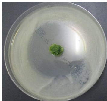
(抗菌作用についての研究)