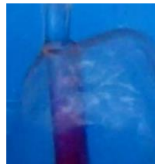
(水膜についての研究)