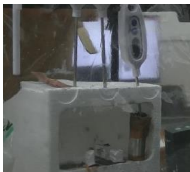
(鉄錆についての研究)