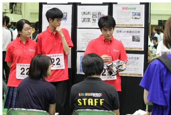
(全国大会での様子)